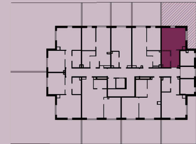
rzut kondygnacji - parter - budynek 4A