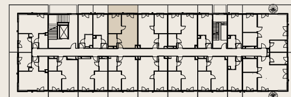
Rzut kondygnacji - piętro 2 - budynek B