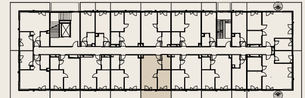
Rzut kondygnacji - piętro 2 - budynek B